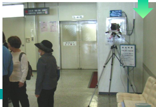
駐車場側入口に設置したサーモグラフィ