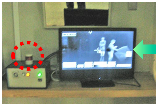
駐車場側入口をモニタとアラームユニットで監視熱者が通るとアラーム音・パトライトが点灯