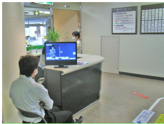
病院の職員が輪番で監視にあたっている