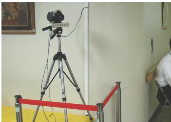
正面玄関入口に設置したサーモグラフィ