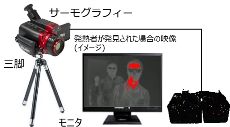
アラーム付き体表温度検査システム