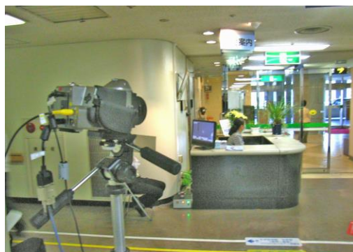
正面玄関からの来院者の発熱を監視

消毒の励行とサーモグラフィによる監視を来院者に通知発熱が認められた場合、マスク着用、専用受診待合の案内、病室への立ち入り規制をお願いしている。