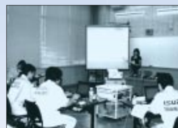
▲研修センターでのスタッフ研修の様子。明るい室内でも投映画面がはっきり見えるので、手元資料に目を通しながら画面の説明を受けられる。