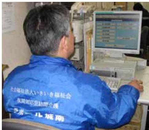
▲ケアコールセンター装置による 介護モニタ