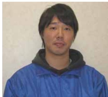
▲お話を伺ったラポール城南富田様

ラポール城南様は、平成19年(2007年)4月1日に開所され、神奈川県藤沢市・茅ヶ崎市在住の高齢者の方に夜間も在宅で安心して生活をして頂く為に、夜間対応型訪問介護事業を運営されています。