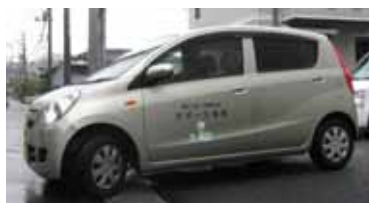
▲定期巡回に活躍中

このような地道な作業をしていくうちに、ケアマネージャーが複数在籍している社会福祉法人の方がサービスを広めてくださったり、市の協力で広報誌に事業概要を載せたりして、ケアマネ・介護ヘルパーの間やご利用者の方々に徐々にこのサービスが浸透していきました。これにより在宅介護に一番必要であった夜中や朝方のご家族が一番ご苦労をされている時間のご負担をカバーできるようになり、今ではケアマネ・介護ヘルパー、ご利用者様、そのご家族の方々からも当社の夜間介護サービスは良いと評価を頂いています。」