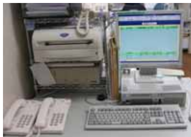
▲ケアコールシステム